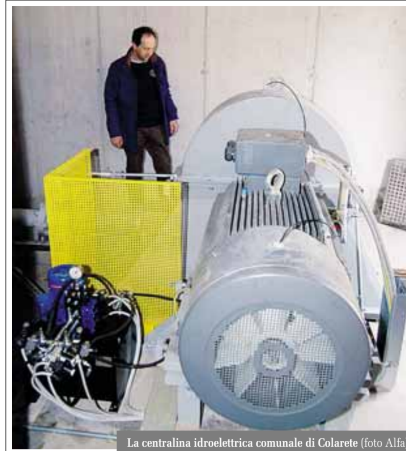
La centralina idroelettrica comunale di Colarete

Sulle altre iniziative in corso in paese, spiega Pedretti: «Un gruppo di volontari, coordinati da Danilo Fornoni, ha disboscato un'area adiacente al parco giochi di Novazza. Lì, su appo-