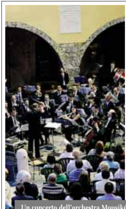
Un concerto dell'orchestra Mousiké